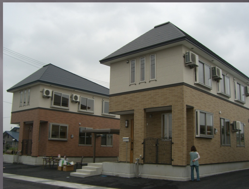
戸建マンション リジェンド