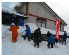
雪かきボランティア活動